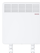
CWM 750 M-F