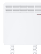
CWM 1000 M-F