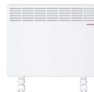
CWM 1500 M-F