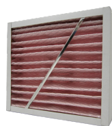
FMK F7-10 ZUL dez. 800/870