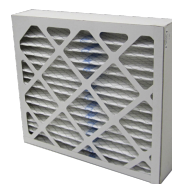
FMK M5-2 ABL dez. 300