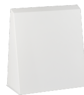
LTM dezent 300 BA VA 320 W