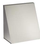
LTM dezent BA VA 410 B