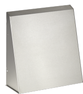
LTM dezent 300 BA VA 320 B