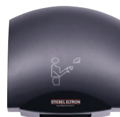
HTT 5 AM