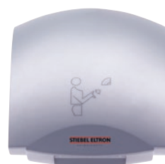
HTT 5 SM