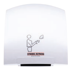
HTE 4 i HTT 4 WS